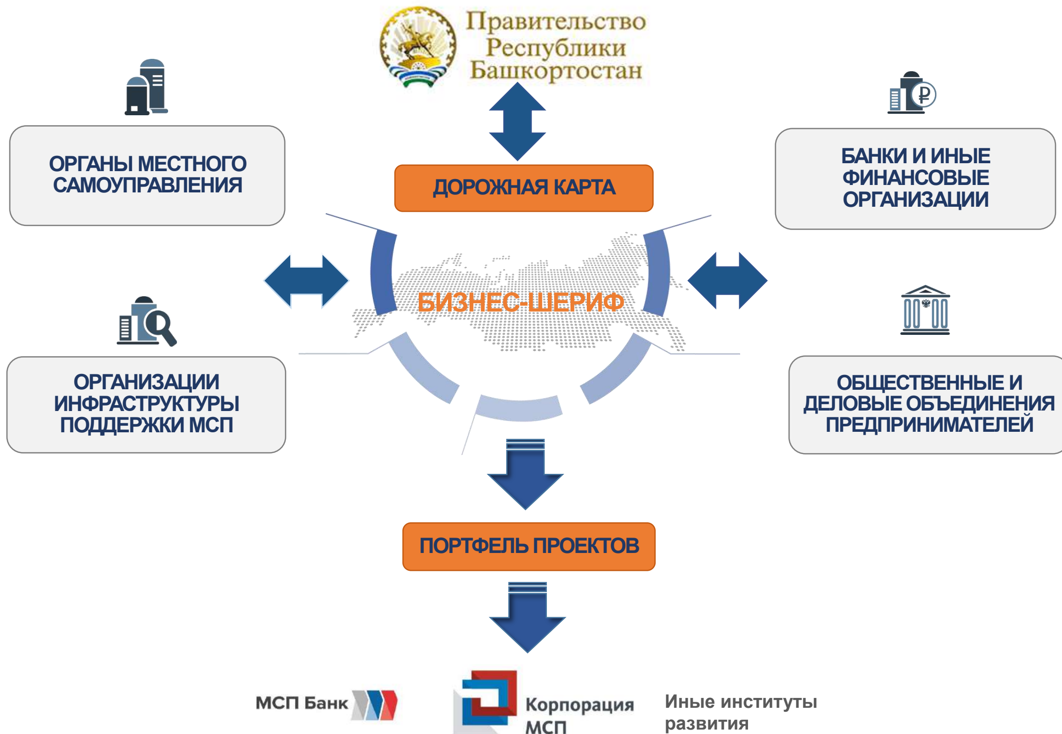
Схема организации работы по взаимодействию с институтами развития