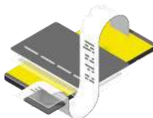
Обновление ПО кассы