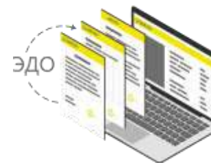
Подключение к ЮЗ ЭДО